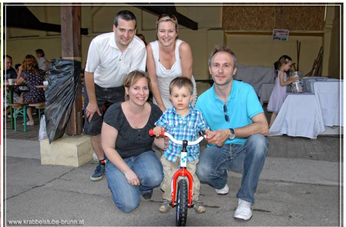
Rechts: Der glückliche Gewinner des Tombola-Hauptpreises beim Sommerfest 2014 wagt erste Fahrversuche auf dem soeben gewonnenen neuen Laufrad.

Dieses Sommerfest und der dabei erzielte Reinerlös, stehen ganz im Zeichen dringend anstehender Investitionen. Als Erstes bedarf die Abgrenzung (Maschendrahtzaun) zwischen dem Gartenbereich der Krabbelstube und dem Kindergarten umgehend einer Sanierung.