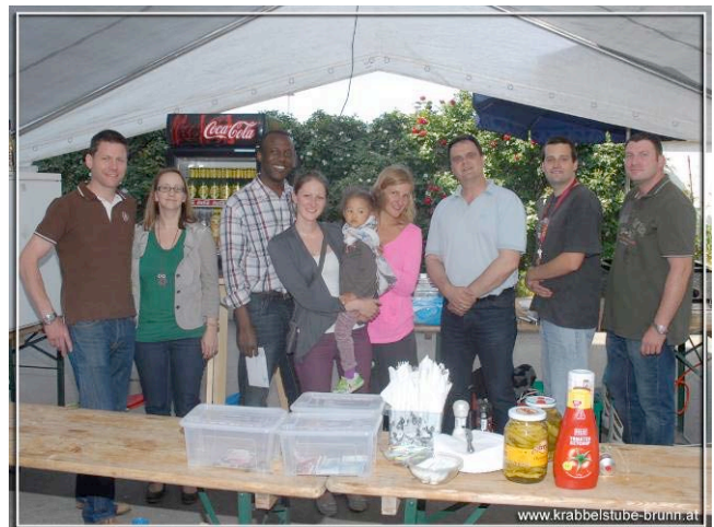
Rechts: Zahlreichen Gäste werden zum Sommerfest 2013 erwartet.